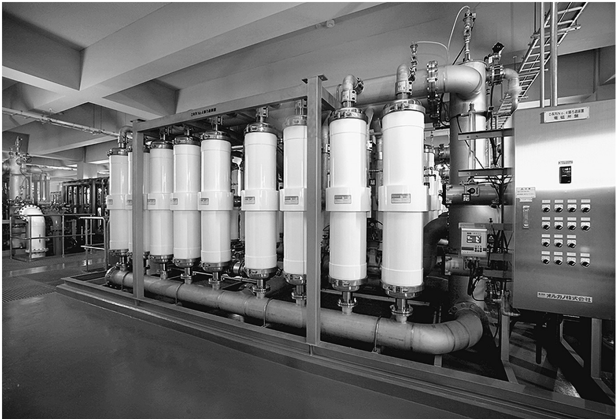
江山浄水場 膜ろ過ユニット