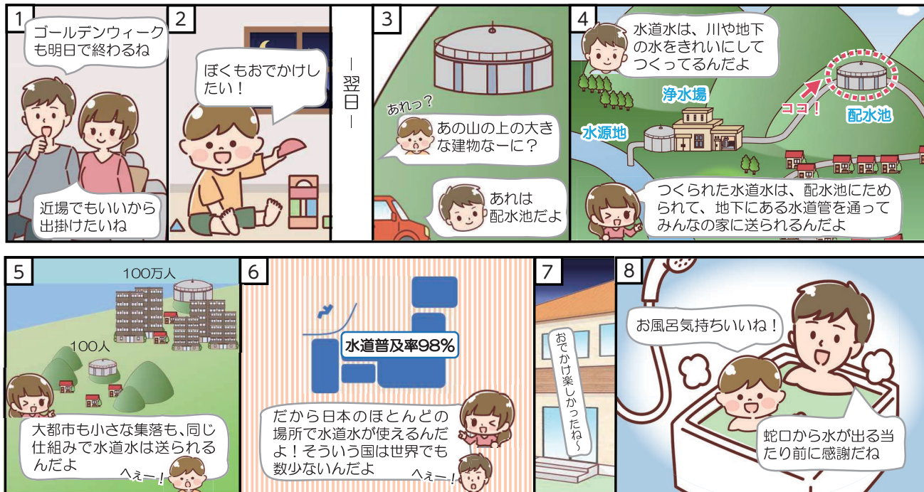
※鳥取市の水道普及率は99.3%です。