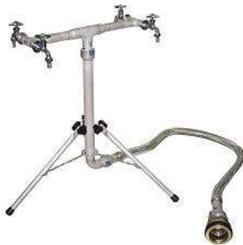
応急給水栓の例（明和工業株式会社）